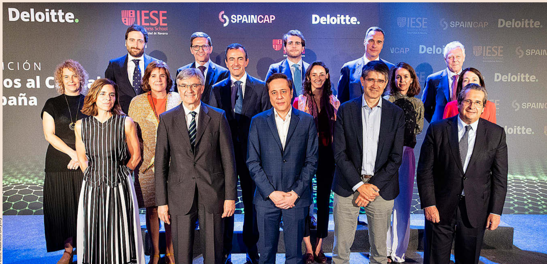
Los premiados posan en la foto de familia junto a los miembros de la organización tras la clausura de la ceremonia, que tuvo lugar en el Teatro Real en Madrid.

GALARDONES/ DELOITTE, SPAINCAP (ANTES ASCRI) E IESE BUSINESS SCHOOL ENTREGAN POR DECIMOQUINTA OCASIÓN LOS PREMIOS QUE DISTINGUEN LAS OPERACIONES MÁS DESTACADAS DE 'VENTURE CAPITAL' Y 'PRIVATE EQUITY' EN ESPAÑA EN EL ÚLTIMO AÑO.